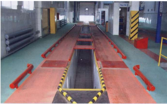
Лучшая диагностическая станция по итогам 2008 г.

нического осмотра. В результате проведенных изменений техосмотр в Беларуси остался по-прежнему государственным, поскольку именно государство в наиболее полной мере понимает всю важность вопроса обеспечения безопасности в сфере перевозок.