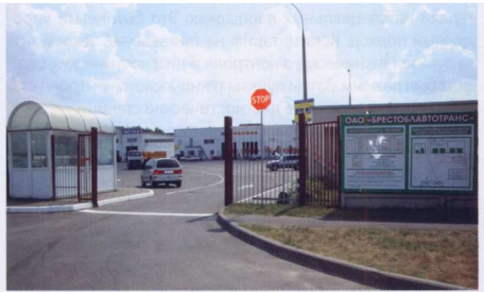
Лучшая диагностическая станция по итогам 2010 г.