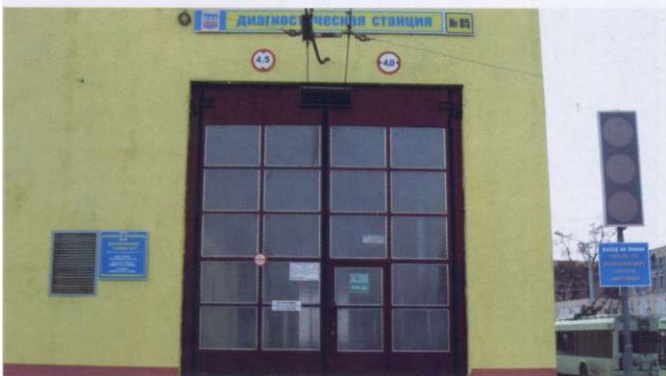
ДС № 85, филиал «Троллейбусный парк №4», Минск

Поскольку на тот момент в Беларуси уже действовало обязательное страхование гражданской ответственности автовладельцев, то созданный в его рамках фонд для проведения превентивных мероприятий был направлен на организацию сети пунктов технического контроля, которая развивалась достаточно быстрыми темпами. В кратчайшие сроки вся страна была обеспечена пунктами по проведению инструментального контроля. Сначала их открыли около 60. Но там не было тормозных стендов, тормоза про-