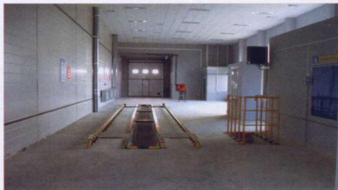
ДС № 75 УП «Белтехосмотр», г. Малорита