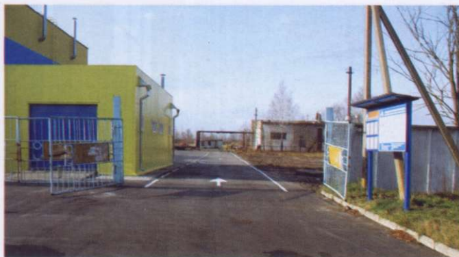
ДС № 213 Лунинецкого РайПО, г. Лунинец

проведение обследования диагностической станции уполномоченной организацией «Белтехосмотр»;