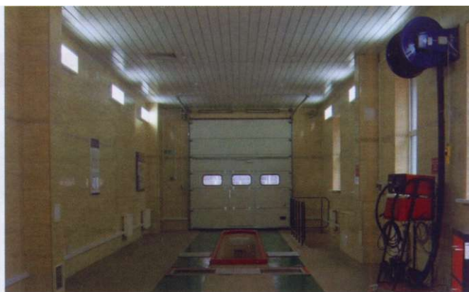
ДС № 214 РУП «Беларусьнефть», Минский р-н

оформление уполномоченной организацией заключения о состоянии диагностической станции;