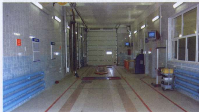
ДС № 208 УО «БГСХА», г. Горки